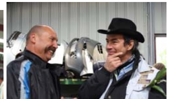
Le président à l'écoute de ses adhérents

La pluie est même à l'heure puisqu'elle ne tombe qu'au moment de l'apéritif offert par BTVA, alors que nous sommes bien à l'abri sous le hangar et que la visite est terminée. J'vous l'dis c'est tout pile !!